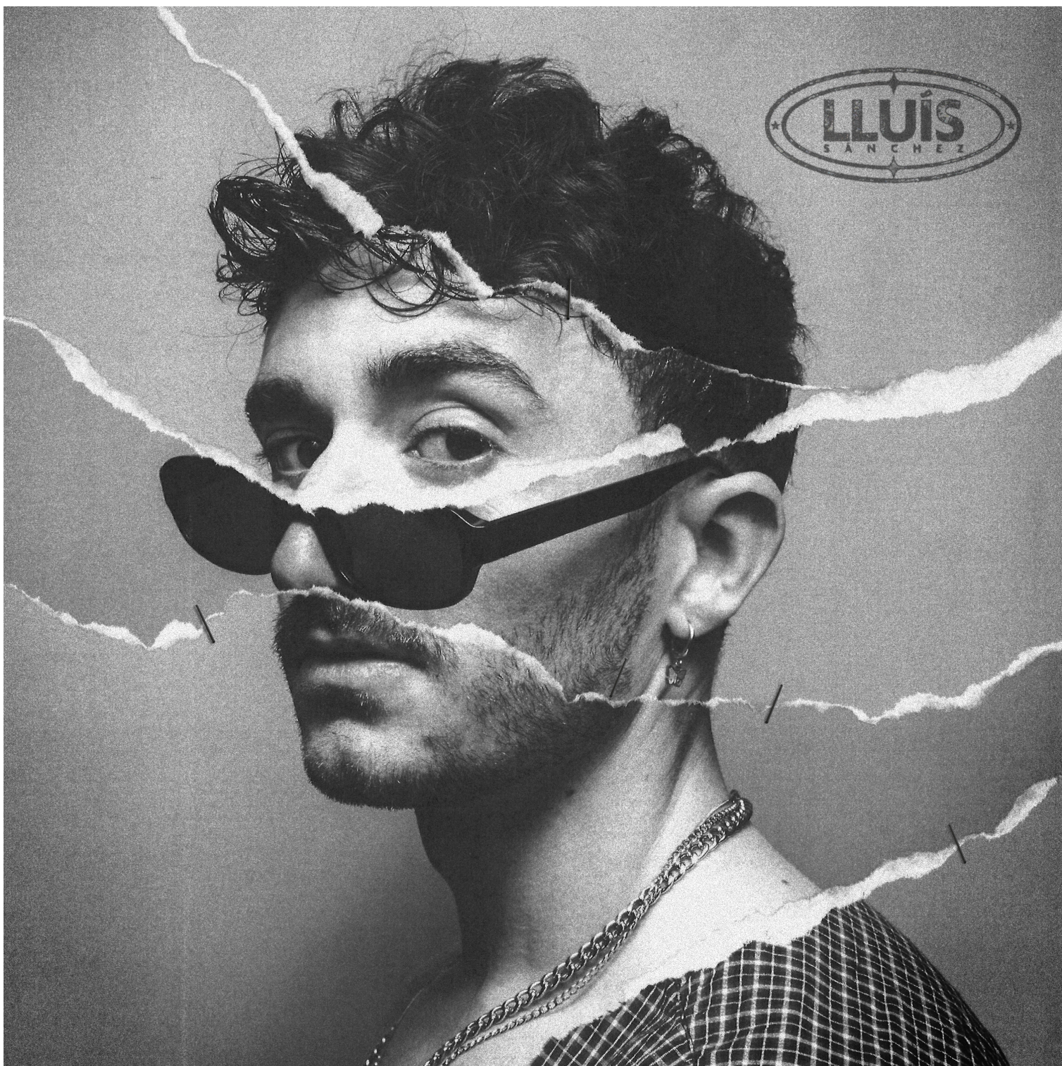
Portada de l'EP "Una versió més gastada"

Aquest EP neix després del pas pel programa Eufòria, on l'artista es va proclamar guanyador de la tercera edició. Una etapa que, com explica, es viu molt intensament; tant pel bo com pel dolent.